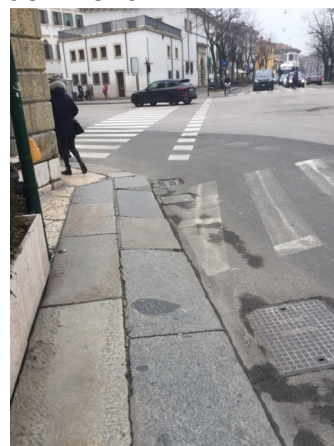
Foto del rilievo

Dislivello causato da gradino di 2/30 cm